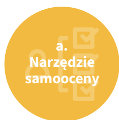
a. Narzędzie samooceny

Uczniowie-recenzenci mogą gromadzić dane w trakcie procesu na różne sposoby. W niniejszym Przewodniku formy zbierania danych objaśniono poniżej. Uczniowie mogą skorzystać tylko z jednej, z dwóch lub z wszystkich metod wymienionych poniżej.