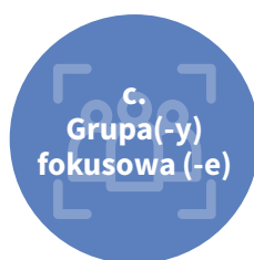
c. Grupa(-y) fokusowa (-e)